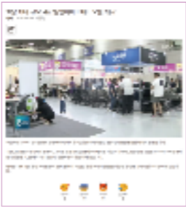
TV, 인터넷 뉴스 보도 / DB 약 20만개 보유