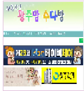
광주지역 최대맘카페 / 회원수 약 8만명