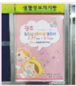
아파트 게시판 부착 / 병원, 돌잔치, 스튜디오 등 배포