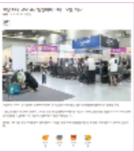
TV, 인터넷 뉴스 보도 / DB 약 20만개 보유