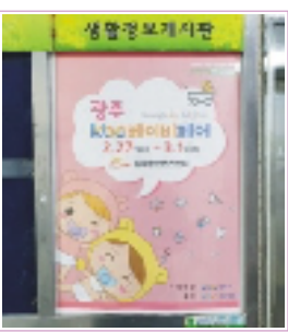
아파트 게시판 부착 / 병원, 돌잔치, 스튜디오 등 배포