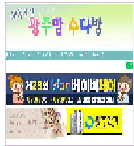
광주지역 최대맘카페 / 회원수 약 8만명