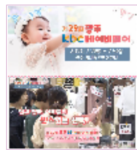
광주, 전남 약 350만명 시청 / 30일간 SA타입 송출

광주 kbc베이비&키즈 페어는 각 부문을 대표하는 리더 기업들이 참가하는 호남최대규모의 유아박람회입니다. 호남 최대 규모의 전문 전시회라는 명성에 걸맞게 적극적이고 다각적인 홍보활동을 통해 참여업체들로 하여금 최고의 효과를 거둘 수 있도록 노력하겠습니다.