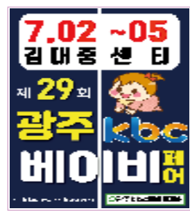
광주 전지역 200조 계첩