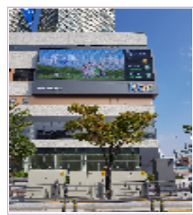
광주최대 유동인구 유스퀘어 맞은편 / 1일 약 120회 송출