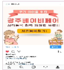
개최소식, 이벤트 공지